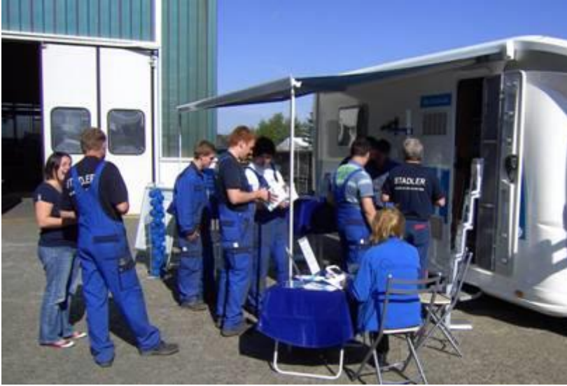
Firma Stadler, Altshausen bei Ravensburg, Spezialanbieter für Sortier- und Aufbereitungsanlagen der Entsorgungsindustrie